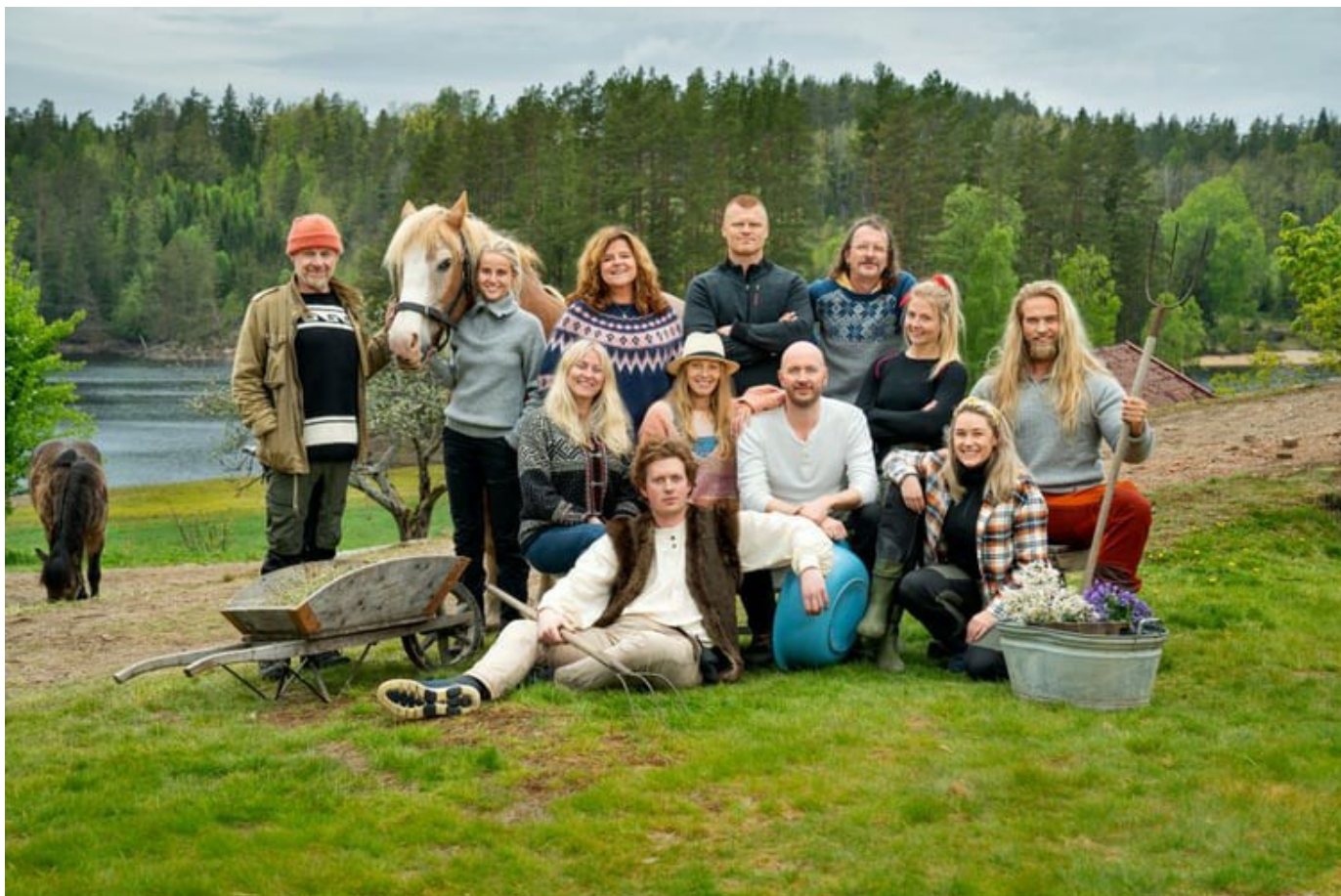
Deltagerne i Farmen kjendis 2021.

AV SIMEN FAABERG/NEWSLAB | PUBLISERT 8. JUL. 2021 | OPPDATERT 31. AUG. 2022