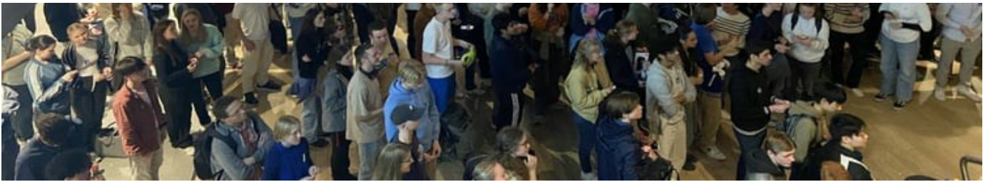
Mange ungdommer samlet under Researchers' Night-arrangementet Forskernatt på NTNU i 2023.

Det er mange andre flotte arrangementer rundt i landet på Researchers' Night, og kreativiteten er stor når det gjelder å skape arrangementer som tiltrekker seg publikum en fredagskveld.