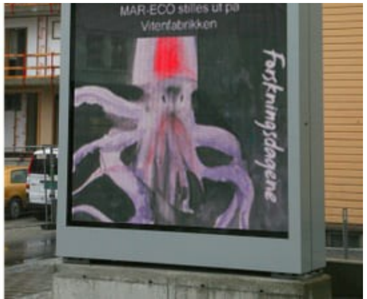
En spesialutstilling av billedkunstner Ørnulf Opdahl var en del av åpningsarrangementet for Forskningsdagene 2008 i Sandnes. Årets hovedtema var miljøvennlig energi, i tillegg til festivalens deltema, kunst og vitenskap. Utstillingen viste malerier fra hans deltagelse på havforskningsekspedisjonen MAR-ECO i regi av Havforskningsinstituttet.