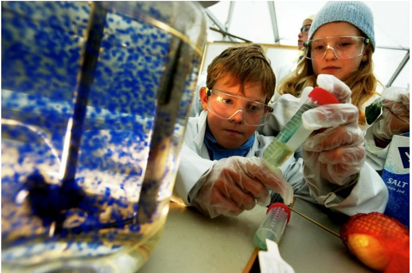
Barn deltar i eksperiment under en av de aller første Forskningsdagene. Festivalen lar barn og voksne komme tett på forskning.