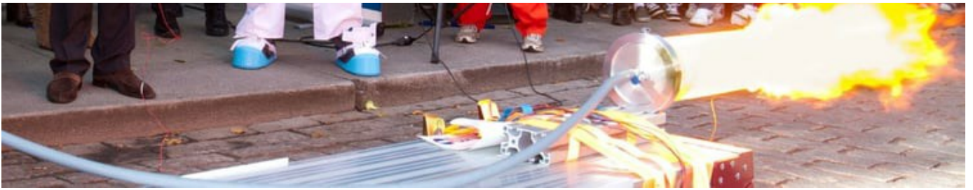
H.K.H. Kronprins Haakon satte fart i åpningen av Forskningsdagene i 2011. Her starter han rakettmotoren på forskningstorget i Oslo.

Meldinger ved utskriftstidspunkt 16. juni 2026, kl. 13.16 CEST