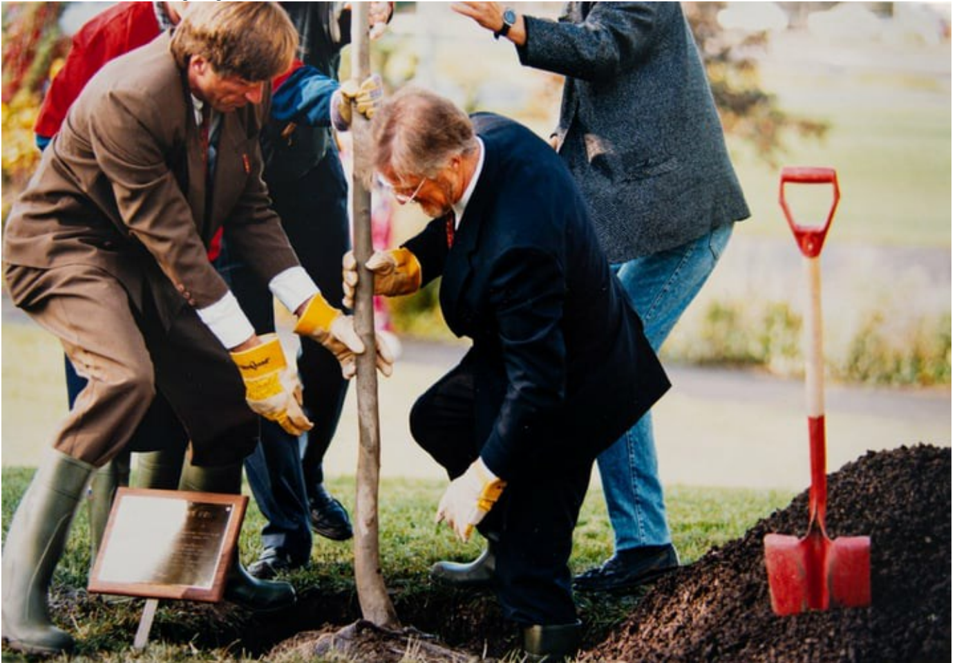
Kommunikasjonsdirektor Paal Alme og kunnskapsminister Gudmund Hernes planter "Kunnskapens tre" under de første Forskningsdagene.

Flere bilder fra Forskningsdagene de siste 30 årene